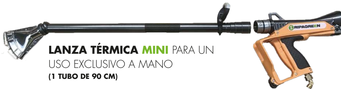
LANZA TÉRMICA MINI PARA UN USO EXCLUSIVO A MANO (1 TUBO DE 90 CM)