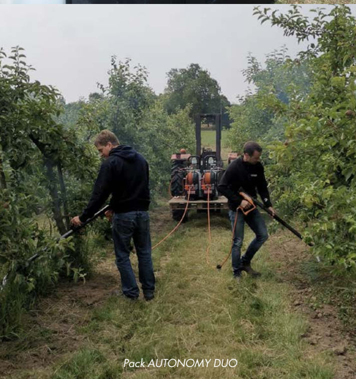
Pack AUTONOMY DUO