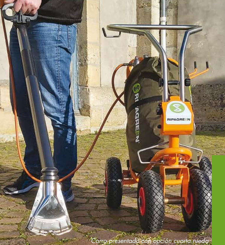
Carro presentado con opción cuarta rueda