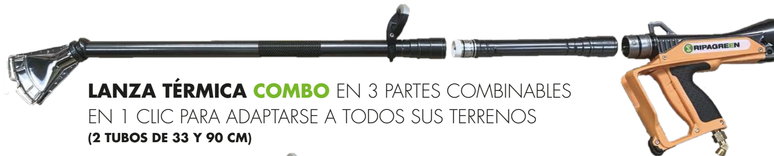
LANZA TÉRMICA COMBO EN 3 PARTES COMBINABLES EN 1 CLIC PARA ADAPTARSE A TODOS SUS TERRENOS (2 TUBOS DE 33 Y 90 CM)